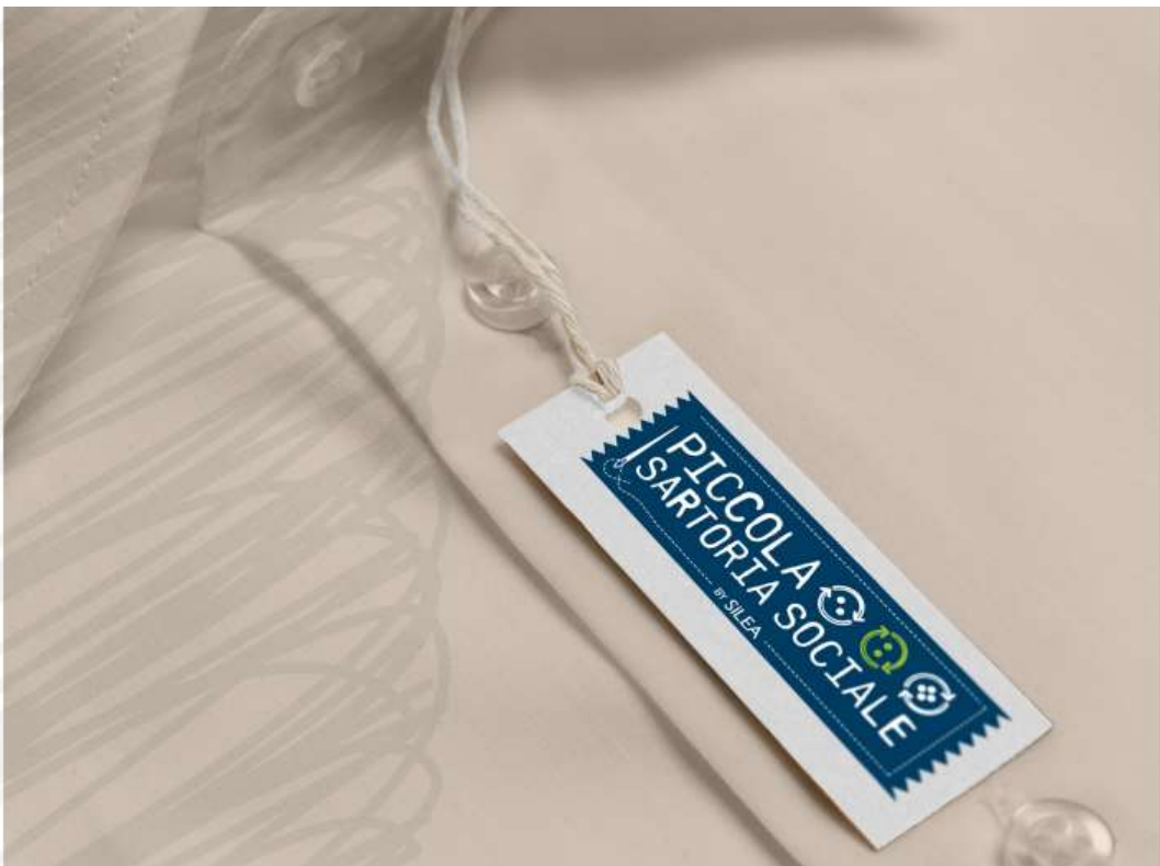
STAMPA SU CARTA BIANCA