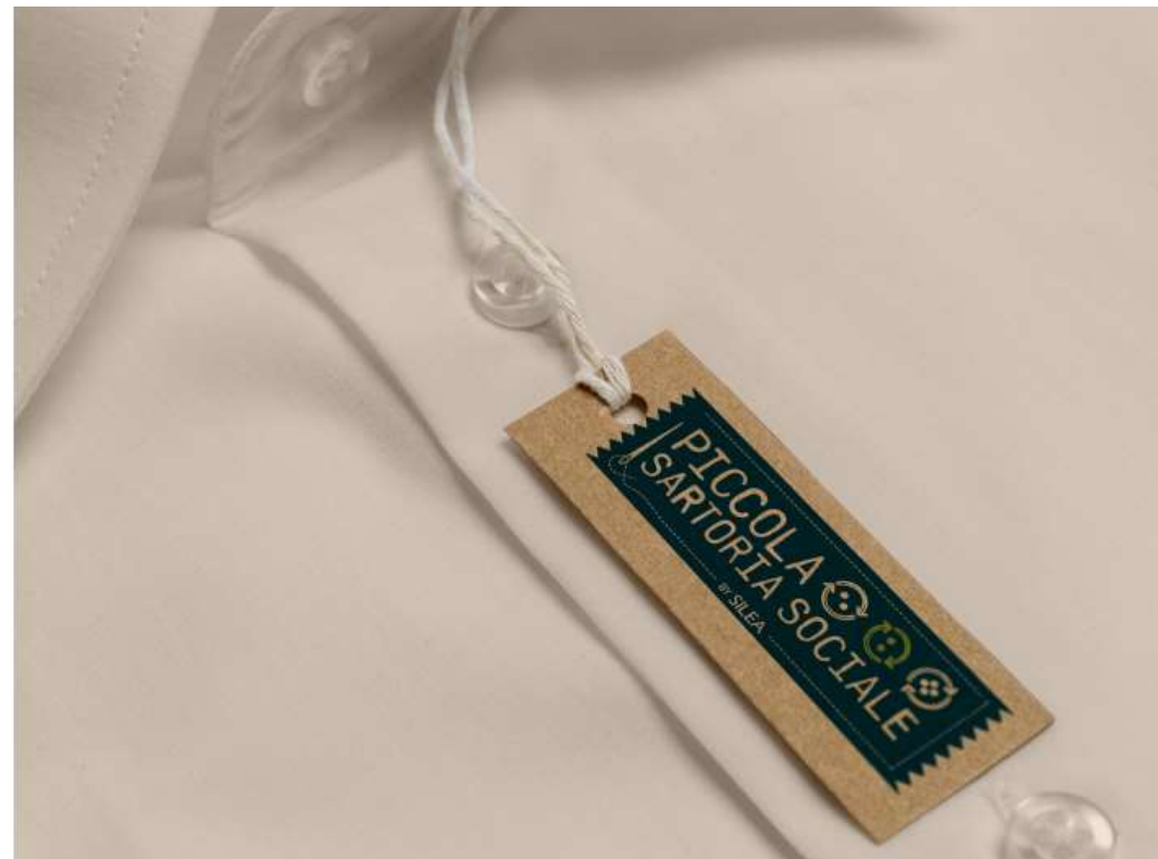
STAMPA SU CARTA KRAFT